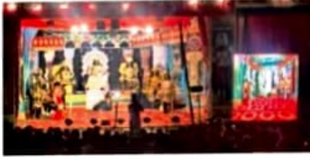
कोर्टा सुर्द में श्रीरामलीला में प्रस्तुति देने चलकर।