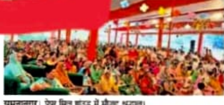
यमुनानगर। पेपर मिल छांडड में श्रीगुरु भद्रानु।

पेपर मिल छांडड यमुनानगर में चल रहा 10 दिनों का श्री गणेश लक्ष्मी महायज्ञ व श्री मद्भागवत कथा यमुनानगर। श्री लक्ष्मी गणेश महायज्ञ एक करोड़ आहुतियां पूर्ण। पेपर मिल छांडड यमुनानगर में चल रहा 10 दिनों का श्री गणेश लक्ष्मी महायज्ञ व श्री मद्भागवत कथा।