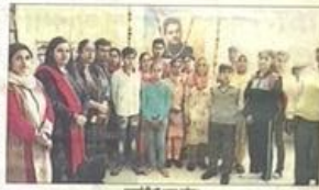
सड़क हादसे में मृत छात्र की पेंटिंग की कॉलेज में लगाई प्रदर्शनी