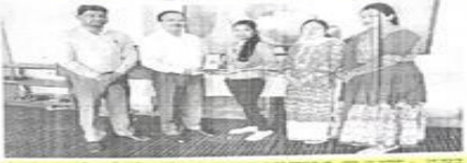
प्रथम पुरस्कार जीतने वाले विद्यार्थियों के साथ कार्यक्रम के आयोजकों का फोटो।

आज का दिन अत्यंत सफल रहा। कार्यक्रम का आयोजन के अंतर्गत विद्यार्थियों को दीया सजाओ में प्रथम पुरस्कार प्राप्त हुआ। कार्यक्रम में विद्यार्थियों को दीया सजाओ में प्रथम पुरस्कार प्राप्त हुआ। कार्यक्रम में विद्यार्थियों को दीया सजाओ में प्रथम पुरस्कार प्राप्त हुआ।